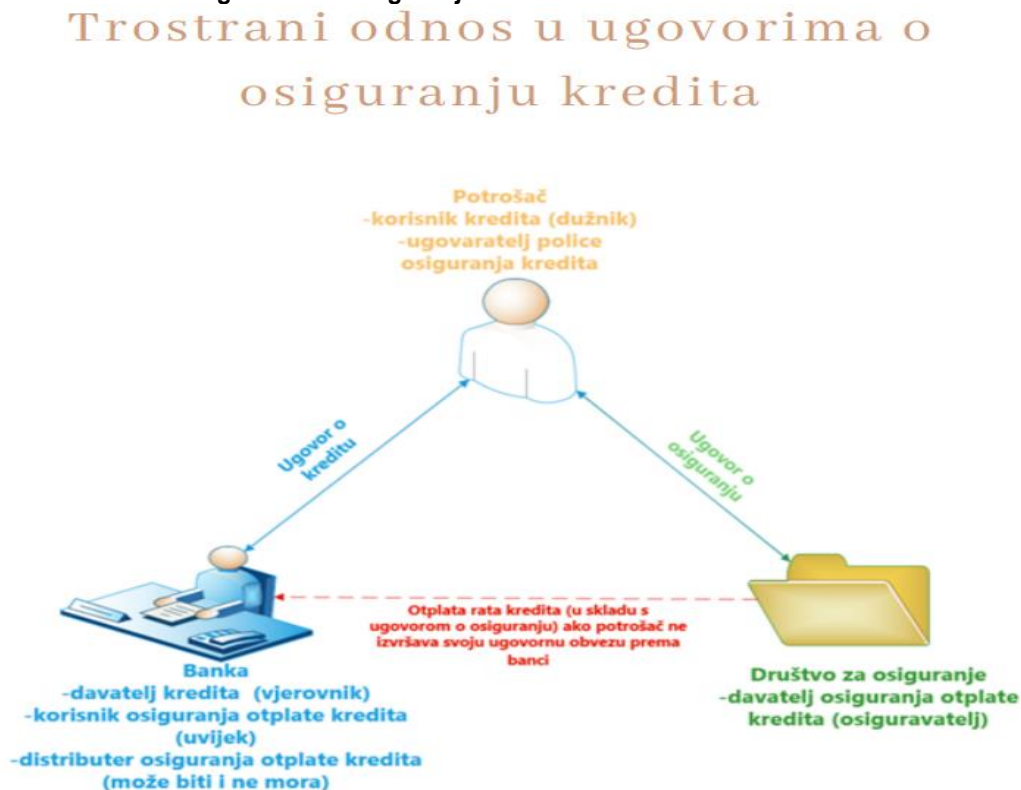
Slika 3 - Prikaz odnosa u ugovorima o osiguranju kredita