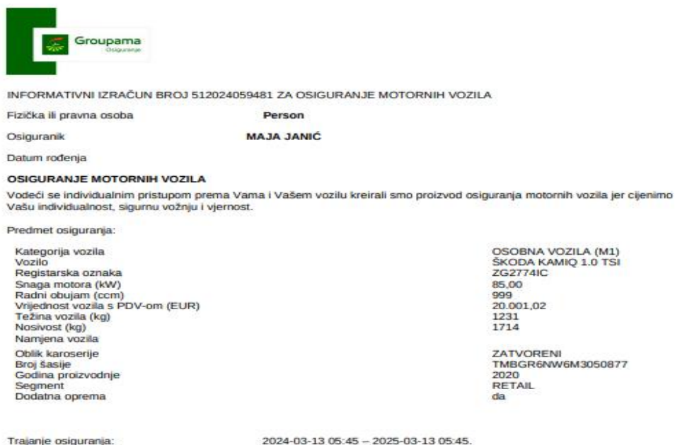
Slika 6 - Informativni izračun police za osiguranje motornih vozila – Groupama osiguranje

Groupama osiguranje nudi policu kasko osiguranja koja uključuje franšizu, što znači da osiguranik snosi dio troškova štete na vozilu prije nego što osiguravajuće društvo preuzme preostali iznos. Ova polica osigurava osnovnu zaštitu od automobilske odgovornosti, kao i pokriće štete na vlastitom vozilu, uključujući i krađu. Uz osnovnu kasu pokriva, dostupne su i dodatne opcije poput osiguranja od nesretnog slučaja, zaštite bonusa i asistencije na cesti, čime se osigurava sveobuhvatna zaštita koja pokriva sve ključne aspekte sigurnosti.