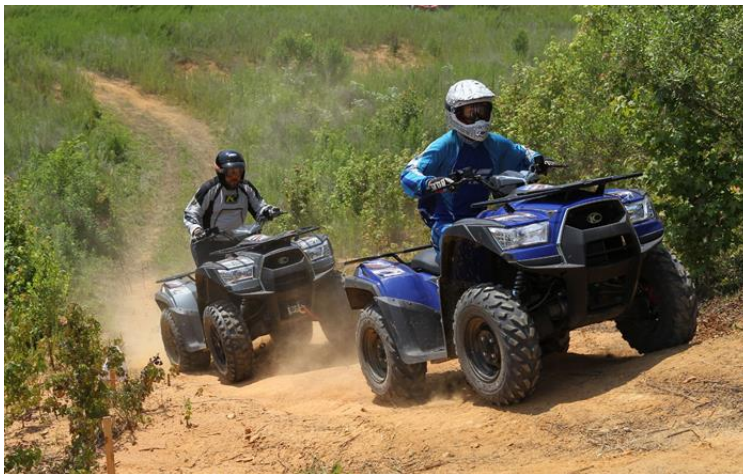
Slika 4: Quad avantura