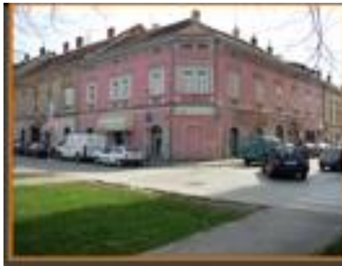
Slika 5: Mjesto na kojem je stajala kuća u kojoj je osnovano "Ilirsko čitanja društvo"

Gradska knjižnica „Ivan Goran Kovačić“ također vrednuje ilirsku baštinu grada Karlovca. Na internet stranici Gradske knjižnice „Ivan Goran Kovačić“ nalazi se povijest knjižnice od njenog osnutka 1. ožujka 1838. godine kao "Ilirsko čitanja društvo" kojom je postala najznačajnija ustanova u gradu. Osim osnutka i razvoja knjižnice kroz godine prikazano je mijenjanje njenih lokacija kroz godine. Navedene ustanove posjetiteljima i građanima približavaju ilirski preporod.