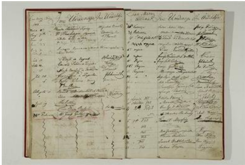
Slika 3: Upisna knjiga posjetitelja Čitaonice ilirske karlovačke