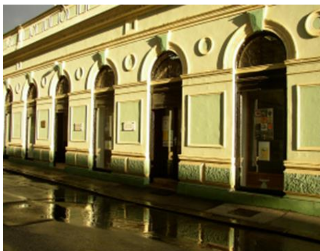
Slika 9: Knjižnica za mlade i Čitaonica

Navedene ustanove trebale bi izraditi i brošure i letke kojima će se promovirati njihova ponuda vezana za ilirsku baštinu grada, ali i na službenim Internet stranicama predstaviti ponudu vezanu za ilirsku baštinu. Izrađene brošure i letke treba dati u ponudu i turističkoj zajednici na raspolaganje da djelatnici turističke zajednice mogu posjetiteljima ponuditi kulturnu ponudu vezanu za ilirsku baštinu našega kraja.