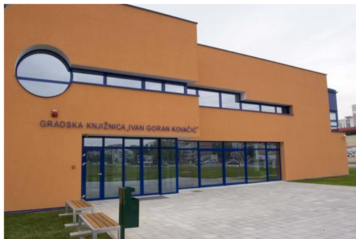
Slika 13: Gradska knjižnica „Ivan Goran Kovačić“