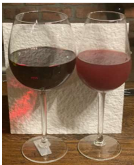
Slika 5. Izgled vina prije i poslije filtriranja

Nakon filtriranja, vino je zablistalo mirisom i okusom i više nije bilo nikakvih naznaka fermentacije, kako se prikazuje na sljedećoj slici.