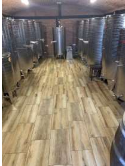
Slika 2. Podrum vinarije RAMARIN

Samo grožđe na trsovima je u stanju prezrelosti, bobice su u stanju prosušivanja i vrijednost izmjerene suhe tvari koncentracije (šećera) izmjereno u stupnjevima Oechslea(*Oe) iznosi 111(*Oe). Kako su kategorije predikatnih vina definirane Zakonom o vinu berba Crnog Pinota 2018. godine spada u kategoriju Izborna berba. Vinarski inspektor na dan berbe uzima uzorak masulja kako bi se dobila potvrda koja nam dokazuje da zaista to grožđe i sama berba spada u kategoriju predikatnih vina Izborna berba. Potvrda vinarskog inspektora je u prilogu rada. Rok berbe određen je po ustaljenim pravilima prateći stanje grožđa, suhe tvari i kiselina. Mjerenjem prije dva tjedna izmjereno je 96 Oechslea što pokazuje rast suhe tvari u bobicama za 15 stupnjeva Oe.