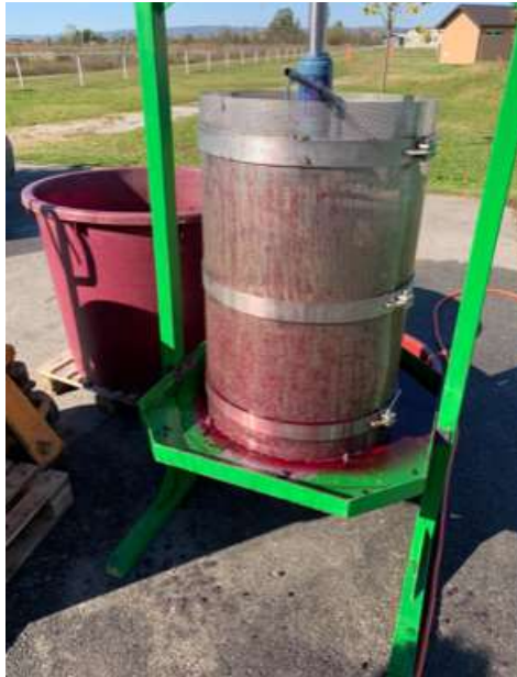
Slika 6. Prešanje crnog Pinota

Grožđe je bilo pet dana u maceraciji a da pri tome nije došlo do fermentacije masulja. Zatim je odrađeno prešanje masulja zajedno kruta i tekuća frakcija i sve zajedno je pretočeno u tank od inoxa.