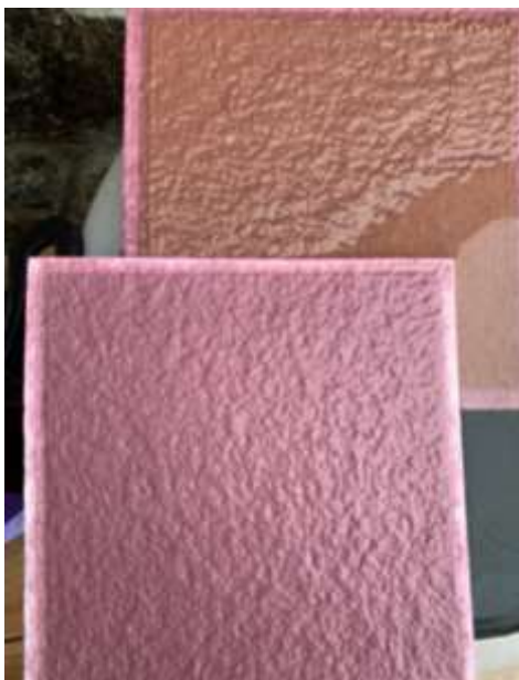
Slika 4. BECOPAD ploča nakon filtriranja

Berba 2018. je još dva puta pretočena bez dodavanja ikakvih umjetnih bistrila samo Sumpovin. Najveći problem s kojim se susrelo je da se počela odvijati refermentacija bez obzira na količinu sumpora 20 u vinu i temperaturu koja je bila ispod 10 stupnjeva. Kako bi se to zaustavilo odrađena je filtracija vina pločastim filterom i to s BECOPAD pločama 450 i 220, takozvana dvostruka polusterilna filtracija. Prilikom filtriranja omjer ploča 20*20 bio je 16-450,14-220, kako je prikazano na sljedećoj slici.