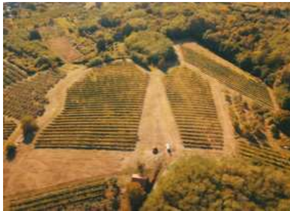
Slika 1. Položaj vinograda vinarije RAMARIN

Godina 2018. po službenim podacima Državnog hidrometeorološkog zavoda (meteo.hr) je još jedna godina koja spada u kategoriju ekstremno topla za cijelu Hrvatsku, a i podatak za oborinske prilike šireg područja Slavenskog Broda za mjesec rujan 2018. godine pokazuju da spada u kategoriju sušno. Većina vinogradara obavila je svoje berbe već krajem kolovoza na području vinogorja Slavonski Brod, pa tako i vinarija RAMARIN, koja je u sklopu ranča RAMARIN, Adresa vinograda je Klokočevik, broj čestice je 1325442, čiji vinograda se prikazuje na slici 1.