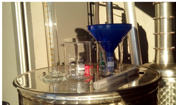
Slika 6. Pribor potreban za maceraciju (Izvor: Autor, 2017)