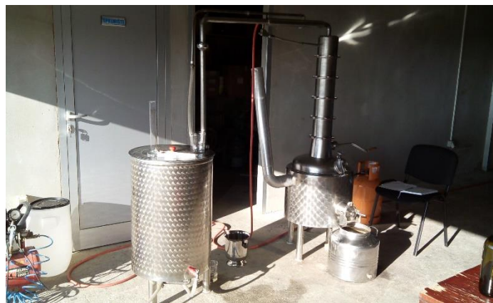
Slika 5. Uređaj za destilaciju

Osnovni dijelovi klasičnog uređaja za pečenje rakije su: kotao s dijelom za destilaciju i dijelom za zagrijavanje, kapa, klobuk ili poklopac (gornji dio kotla), cijev od poklopca do hladila i hladilo s predloškom. (Banić, 2006)