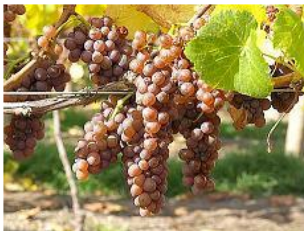
Slika 3. Pinot sivi

Pinot sivi ubraja se u visokokvalitetne bijele sorte, a dozrijeva između 2. i 3. razdoblja. Boje bobica su od blijedo plave do ružičaste, a ljuska ovih bobica je tanka i podložna botritisu. Pinot sivi je neizbirljiva sorta vinove loze kojoj u područjima sjeverne klime odgovaraju plodna, duboka tla u nizinama, a u južnim područjima manje plodna tla na uzvisinama. Karakterizira ga mala rodnost, sklonost grožđa da u kišnoj jeseni trune te srednja otpornost prema smrzavicama. Rodnost mu je puno bolja ako se radi o klonskim selekcijama. U svijetu je poznat po nazivima: Pinot gris, Burgunder, Grigio i sl. (Mirošević i Turković, 2003).