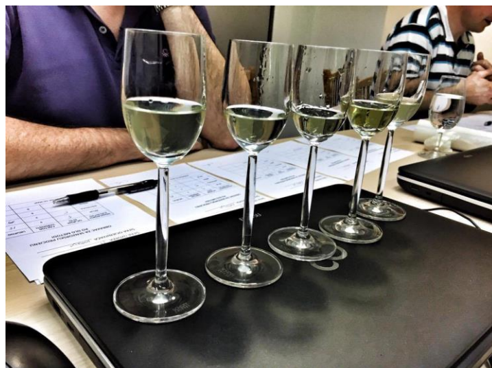
Slika 2. Likeri na ocjenjivanju