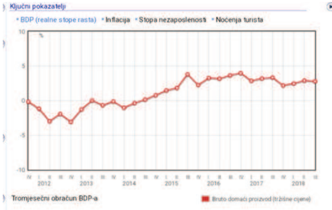
Grafikon br. 1: Tromjesečni obračun BDP-a