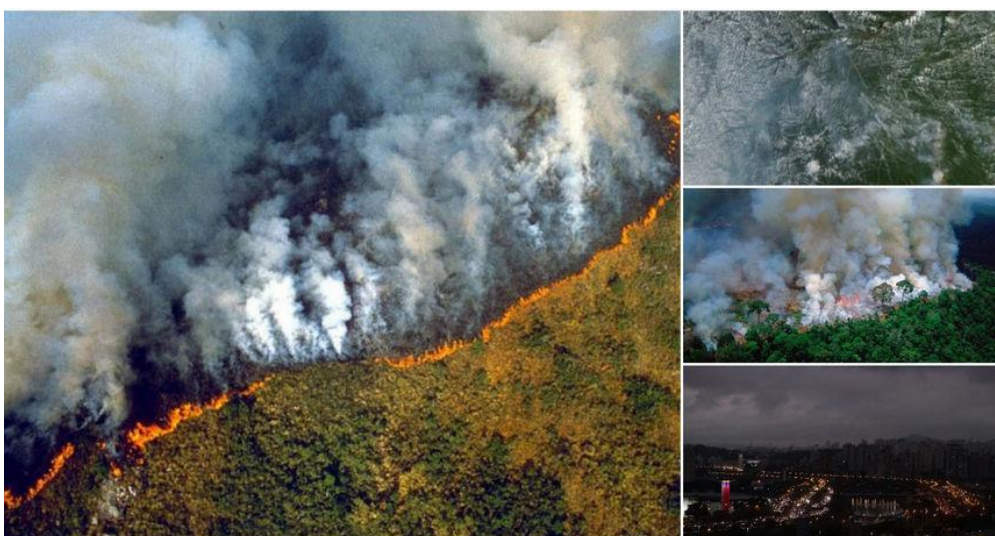
Slika 1. Požari u amazonskoj prašumi koji se vide iz Svemira.