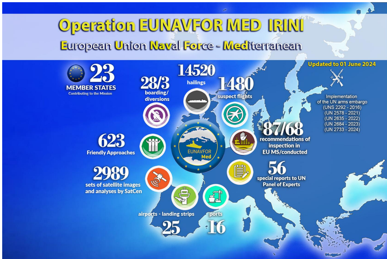
Slika 4. Operaciju EUNAVFOR MED IRINI