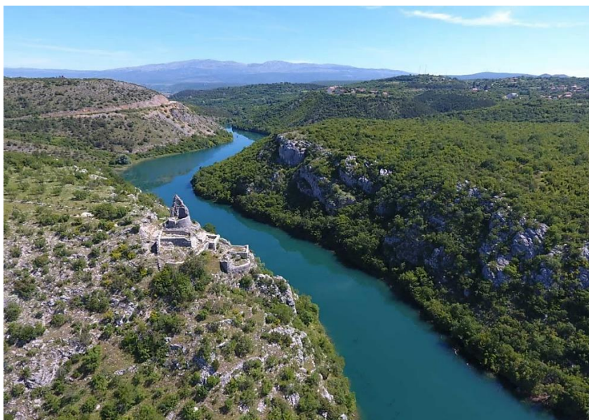
Slika 5. Utvrda Nutjak