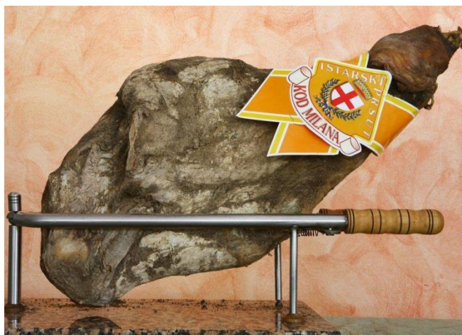
Slika 5. Istarski pršut

Istarski pršut , koji je zaštićen oznakom ZOI, još je jedan primjer proizvoda koji igra važnu ulogu u očuvanju tradicionalnih metoda proizvodnje. Ovaj pršut se suši na zraku, bez dimljenja, i karakterizira ga poseban okus koji se dobiva dugotrajnim sušenjem na bura vjetru. Istarski pršut je nezaobilazan dio istarske gastronomske ponude i redovito se promovira na lokalnim sajmovima i festivalima (Vitez, 2020).