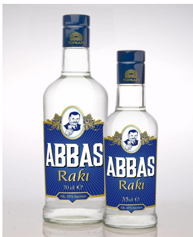
Slika 7. Turski Abbas Raki