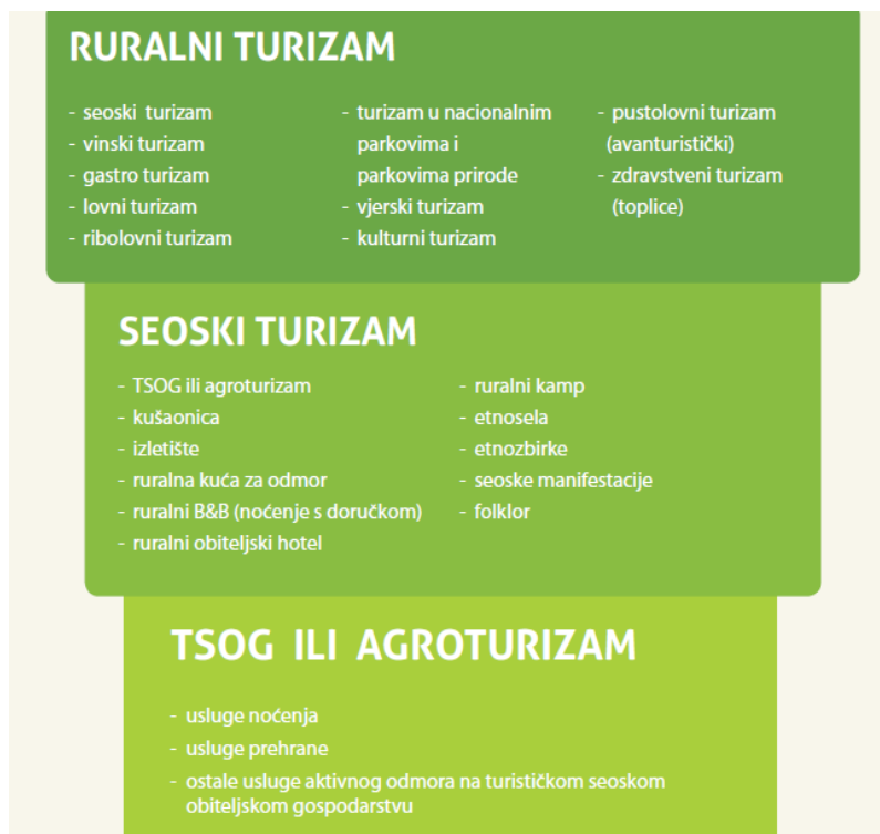
Slika 1. Shematski prikaz međusobnog odnosa ruralnog, seoskog i agroturizma.