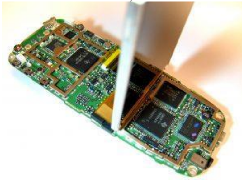
Slika 8. Unutrašnjost mobitela.