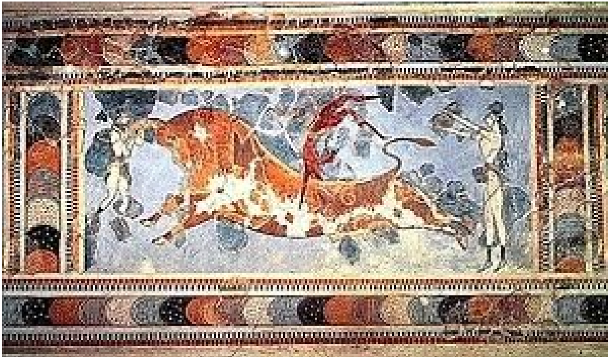
Slika 8. Borbe s bikovima

predmete, kao što su lopte, batovi, štapovi, kugle, ploče, itd. Posebno izgrađeni prostori, kao što su igrališta i borilišta, služili su za održavanje natjecateljskih aktivnosti. Otok Kreta najstarije je nalazište igrališta, odnosno borilišta s gledalištima iz razdoblja između 2600. i 1100. godine pr. Kr. Za kretsku (minojsku) kulturu osobito su karakteristične igre s bikovima (vidi sliku 8. ) (Hrvatska enciklopedija 2020).