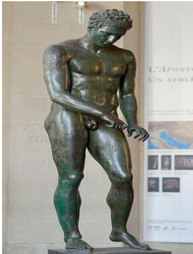
Slika 9. Hrvatski apoksiomen

Odgaj u Ateni razlikovao se od spartanskog odgoja, od kojeg je bio bogatiji i raznovrsniji. Mladež je odgajana u palestru , mjestu namijenjenom tjelesnom odgoju mladića. U 5. st. pr. Kr. dva velika gimnazija postaju središta sportskog odgoja koji se pojavljivao u dva oblika ( gimnastika i agonistika ). Gimnastika je služila za usavršavanje ličnosti te vojni odgoj, dok je agonistika omogućavala postizanje što boljih rezultata. Aktivnosti karakteristične za Stare Grke bile su: trčanje na kraće i duže staze, bacanje diska i koplja, skokovi u dalj s bučicama, hrvanje te boks. Stari Grci uveli su discipline pankraton (kombinacija boksa i hrvanja) te pentatlon (petboj: trčanje, skakanje, bacanje diska i koplja te hrvanje). Grci su u čast boga Zeusa na Olimpu održavali svečanosti na kojima su se odvijala natjecanja. Dokaz da su Grci voljeli natjecanja brojne su sačuvane skulpture koje prikazuju antičke atlete, kao na primjer Apoksiomen koji je pronađen u moru kraj Lošinja (vidi sliku 9. ) (Hrvatska enciklopedija 2020).