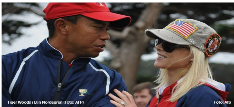
Slika 5: Afera poznatog golfera na naslovnici Dnevnik.hr