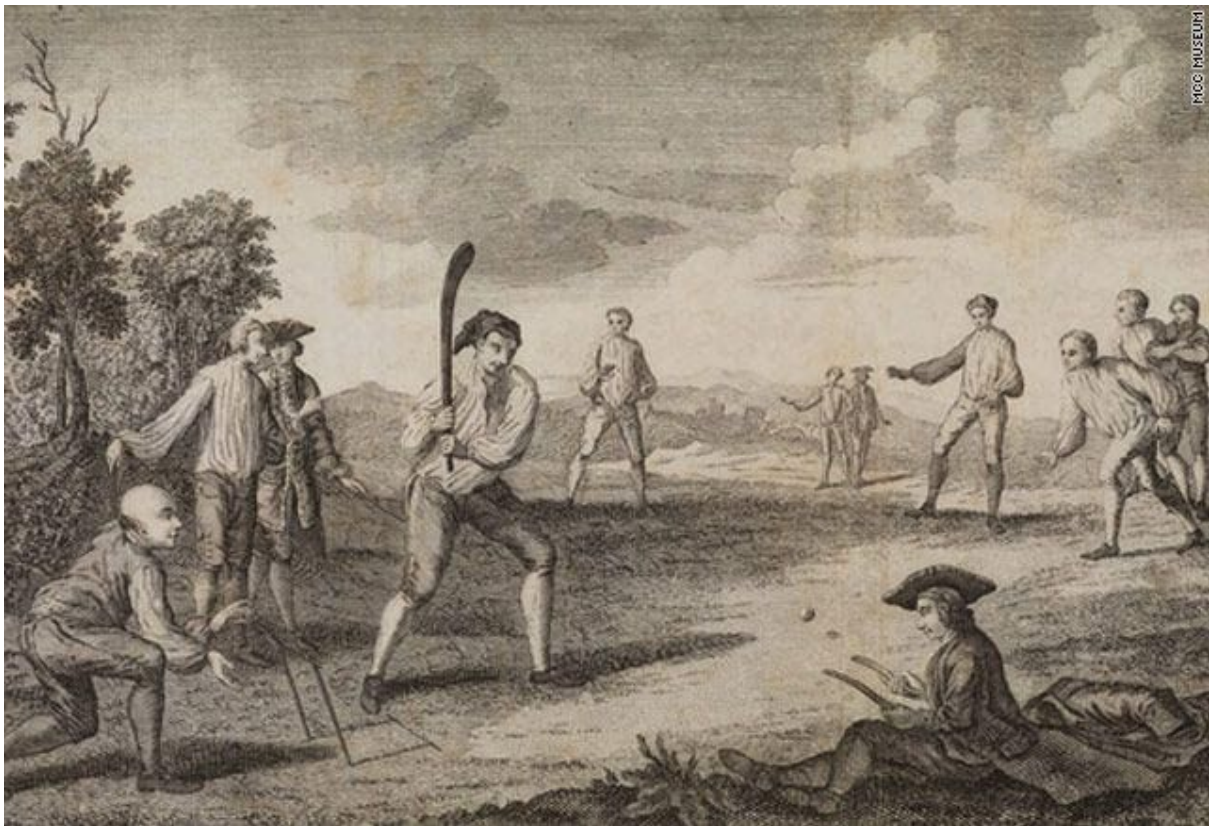
Slika 10. Kriket u Engleskoj (18. stoljeće)

Razdoblje u kojem pojedine sportske discipline prestaju biti predmetom pasivne gledateljske zabave te se ljudi masovno počinju baviti sportom, što je posljedica pojave slobodnog vremena. Dovoljno slobodnog vremena, koje je bilo nužno za vježbanje sportske discipline, imali su prvenstveno povlašteni društveni slojevi. Plemstvo je njegovalo tradiciju jahanja i lova, dok se građanstvo uključivalo u aktivno bavljenje sportom oponašajući plemstvo, ali je na taj način, i samo, uvidjelo važnost sporta za čovjekovo zdravlje. U Engleskoj je sve više ljudi sudjelovalo u sportskim natjecanjima, a najpopularniji sportovi bili su boks i kriket (vidi sliku 10. ) (Hrvatska enciklopedija 2020).