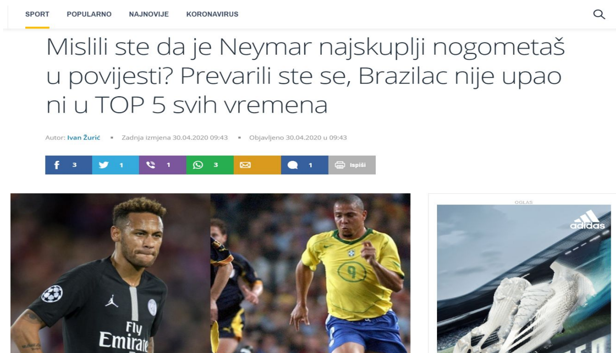
Slika broj 7: Najskuplji nogometni transferi objavljeni na Tportalu

Osim navedenih afera, prostor u medijima i na internetskim portalima, sve češće zauzimaju transferi sportaša i to najviše nogometaša. Činjenica je kako transferi vrhunskih nogometaša iznose ogromne svote novca (vidi sliku 7. ), a sam sport i kvaliteta profesionalnog igrača ostaju po strani. Nadalje, svoje mjesto u medijima imaju i brojni članci posvećeni navijačkim skupinama, rekordima, himnama, znakovljem i brojnim drugim obilježjima.