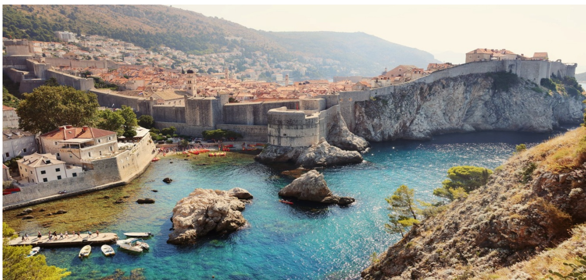
Slika 7. Dubrovnik danas