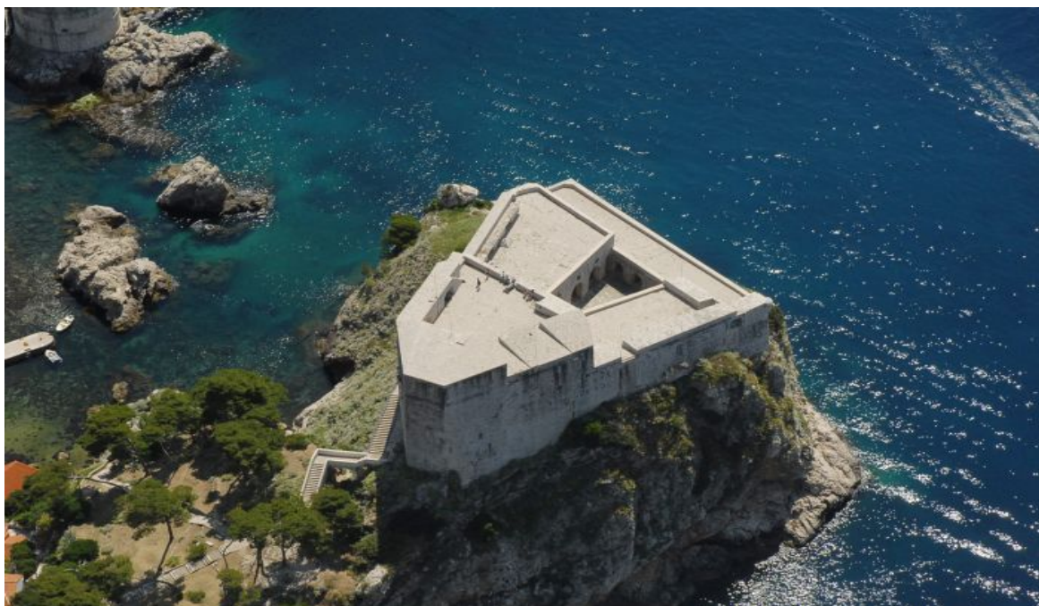
Slika 6. Tvrđava Lovrijenac