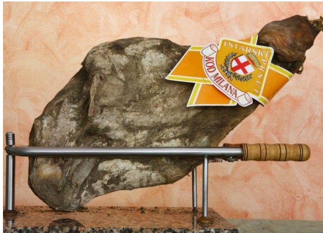
Slika 5. Istarski pršut

Istarski pršut , koji je zaštićen oznakom ZOI, još je jedan primjer proizvoda koji igra važnu ulogu u očuvanju tradicionalnih metoda proizvodnje. Ovaj pršut se suši na zraku, bez dimljenja, i karakterizira ga poseban okus koji se dobiva dugotrajnim sušenjem na bura vjetru. Istarski pršut je nezaobilazan dio istarske gastronomske ponude i redovito se promovira na lokalnim sajmovima i festivalima (Vitez, 2020).