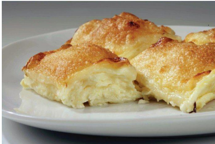
Slika 2. Zagorski štrukli zaštićeni oznakom zemljopisnog podrijetla

U središnjoj Hrvatskoj su osobito poznati Zagorski štrukli . Štrukli su jelo od tankog tijesta punjenog svježim sirom. Mogu kuhati ili peći, a obično se poslužuju s vrhnjem i prženim krušnim mrvicama (Slika 2). Ovaj jednostavan, ali izuzetno ukusan specijalitet često se poslužuje u posebnim prilikama. Purica s mlincima je u središnjoj Hrvatskoj tipično jelo za blagdane i slavlja. Pečena purica poslužuje se s mlincima, tradicionalnim sušenim tijestom koje se kratko prokuha i prelije sokom od pečenja (Barbieri, 2009).