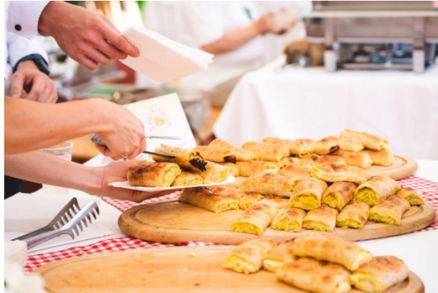
Slika 8. Festival šturklijada