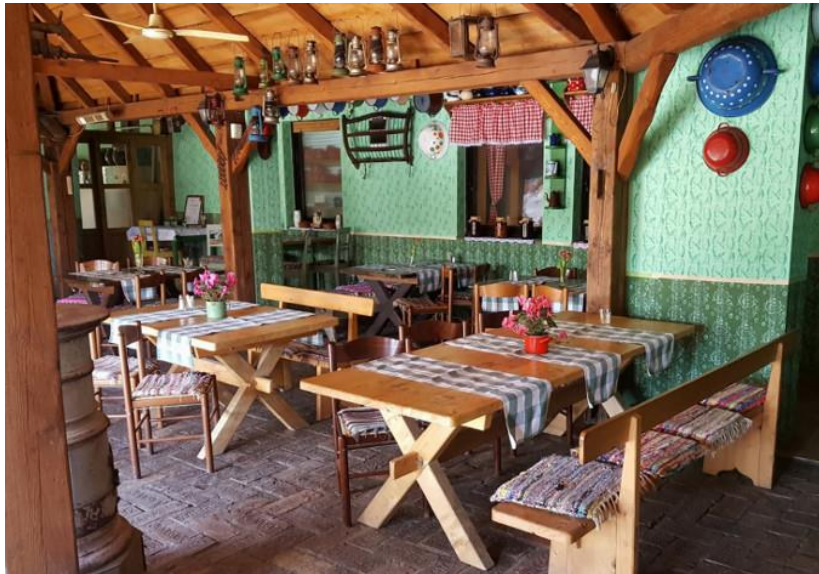
Slika 9. Restoran Baranjska kuća, Karanac

Etno restoran Baranjska kuća (Slika 7.) je obiteljski restoran, smješten u etno selu Karanac, u srcu Baranje. Predstavlja savršen spoj tradicionalne kuhinje i autentične atmosfere. Ovaj restoran poznat je po svojoj ponudi specijaliteta koji odražavaju bogatu kulinarsku baštinu regije.