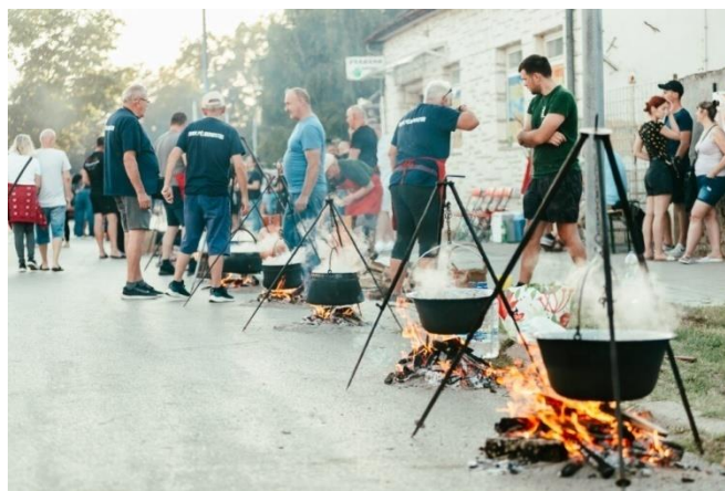
Slika 7. Festival fišijada