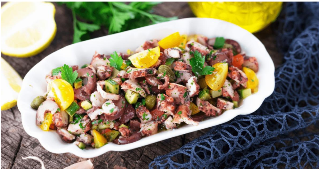
Slika 4. Salata od hobotnice

Salata od hobotnice (Slika 4) je popularno hladno predjelo od kuhane hobotnice začinjene maslinovim uljem, octom, peršinom i lukom (Barbieri, 2007).