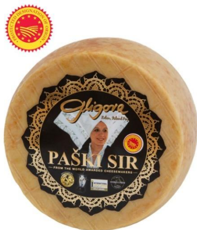
Slika 6. Paški sir