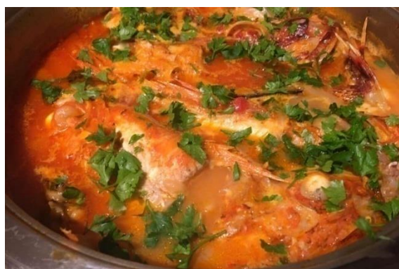
Slika 3. Brudet

Primorska Hrvatska, koja uključuje Istru, Kvarner i Dalmaciju, ima osebujnu mediteransku kuhinju. Regiju karakterizira blaga klima i obilje plodova mora, povrća i maslinovog ulja koji čine temelj prehrane. Međutim, unutar same primorske Hrvatske postoje značajne razlike u kulinarskim tradicijama između obalnog, otočnog i zagorskog područja Dalmacije (Barbieri, 2007). Zbog svoje povijesne povezanosti s Mediteranom, kuhinja hrvatskog priobalja bila je pod velikim utjecajem talijanske i venecijanske kulinarske tradicije. Mlečani su ostavili neizbrisiv trag u kuhinji Istre i Dalmacije, donijevši sa sobom tehnike pripreme plodova mora, korištenje maslinova ulja, vina i začina poput ružmarina i lovora. Povijesne veze s Grčkom također postoje, posebice u Dalmaciji, gdje su masline, smokve i vino od davnina bili glavni sastojci prehrane, a jadranska obala bila je glavna trgovačka ruta koja je dopuštala uvoz začina i drugih egzotičnih namirnica (Barbieri, 2007). Primorska Dalmacija, koja se proteže od Zadra do Dubrovnika, ima prepoznatljivu mediteransku kuhinju s naglaskom na svježim plodovima mora, ribi i povrću. Riba se često priprema na roštilju, kuhana ili poširana u vodi s minimalnim začinjavanjem, uz dodatak maslinova ulja, češnjaka i peršina. Brudet (Slika 3.) je vrlo poznato dalmatinsko riblje jelo od nekoliko vrsta ribe, kuhano u umaku od rajčice, vina i začina. Poslužuje se s palentom kao jedno je od najtipičnijih jela primorske Dalmacije (Barbieri, 2007).