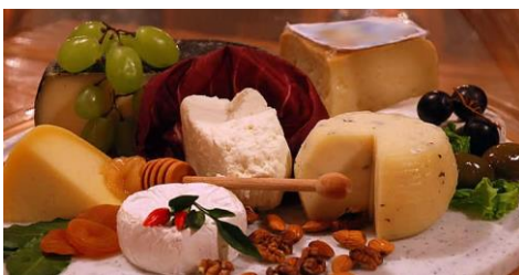
Slika 20. Jela iz hrvatske gastronomske kuhinje