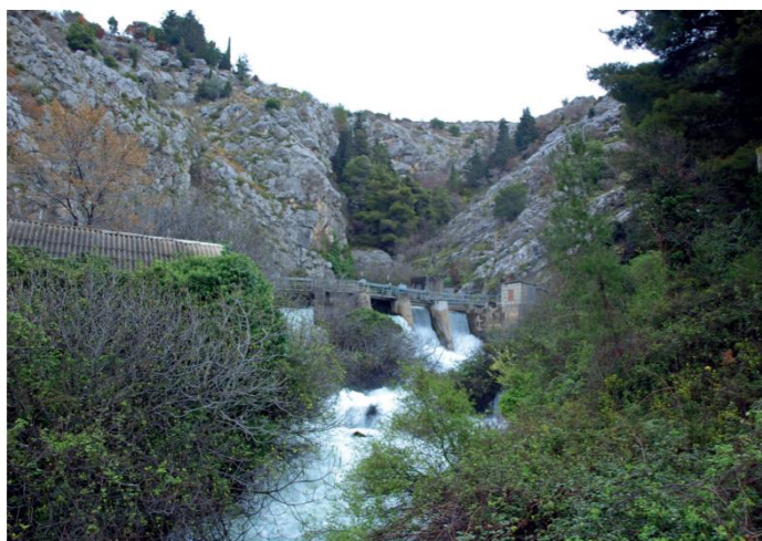
Slika 7. Izvor Jadra